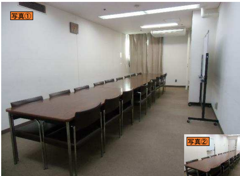
出入口ドアから室内