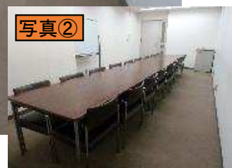
東の窓付近から出入口方向