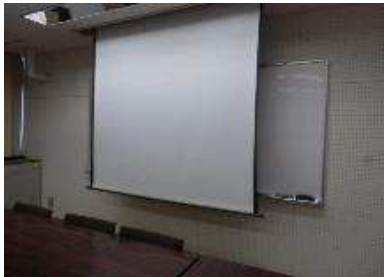
常設スクリーンを降ろしたところ