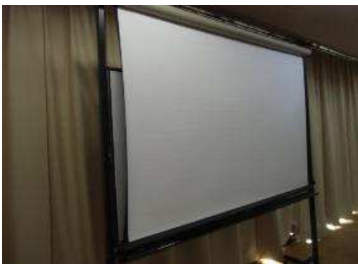
キャスター付き常設ホワイトボード 併設スクリーンを降ろしたところ