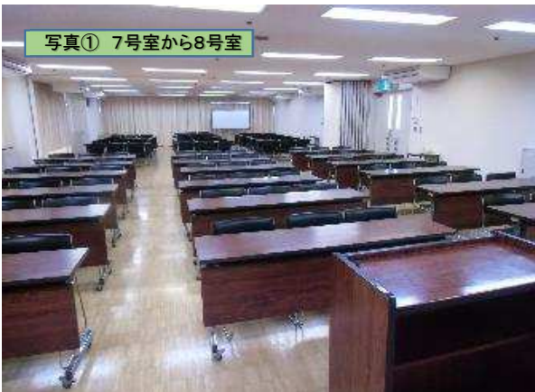
7号室演台付近から8号室方向