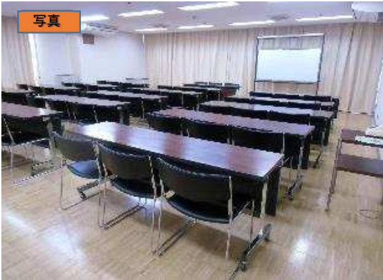
出入口ドアから室内