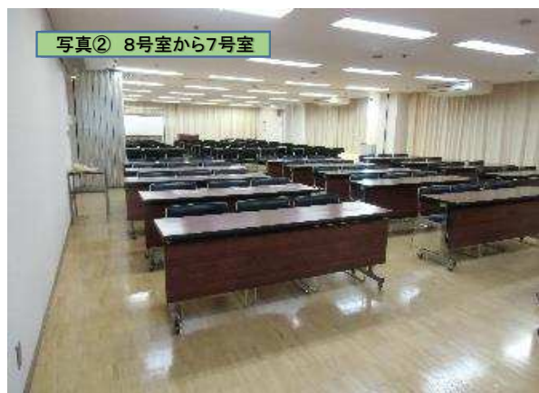
7、8号室を仕切るパーティションを開放 8号室のホワイトボード付近から7号室方向