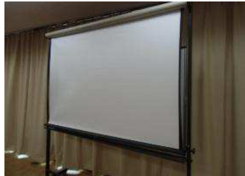
キャスター付き常設ホワイトボード 併設スクリーンを降ろしたところ